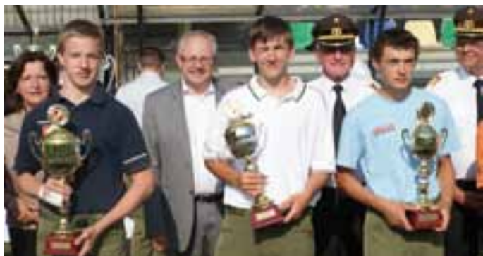
Diese Leistungen waren ein großer Schritt in Richtung des Bundesfeuerwehrajugendleistungsbewerbes nächstes Jahr im Burgenland.